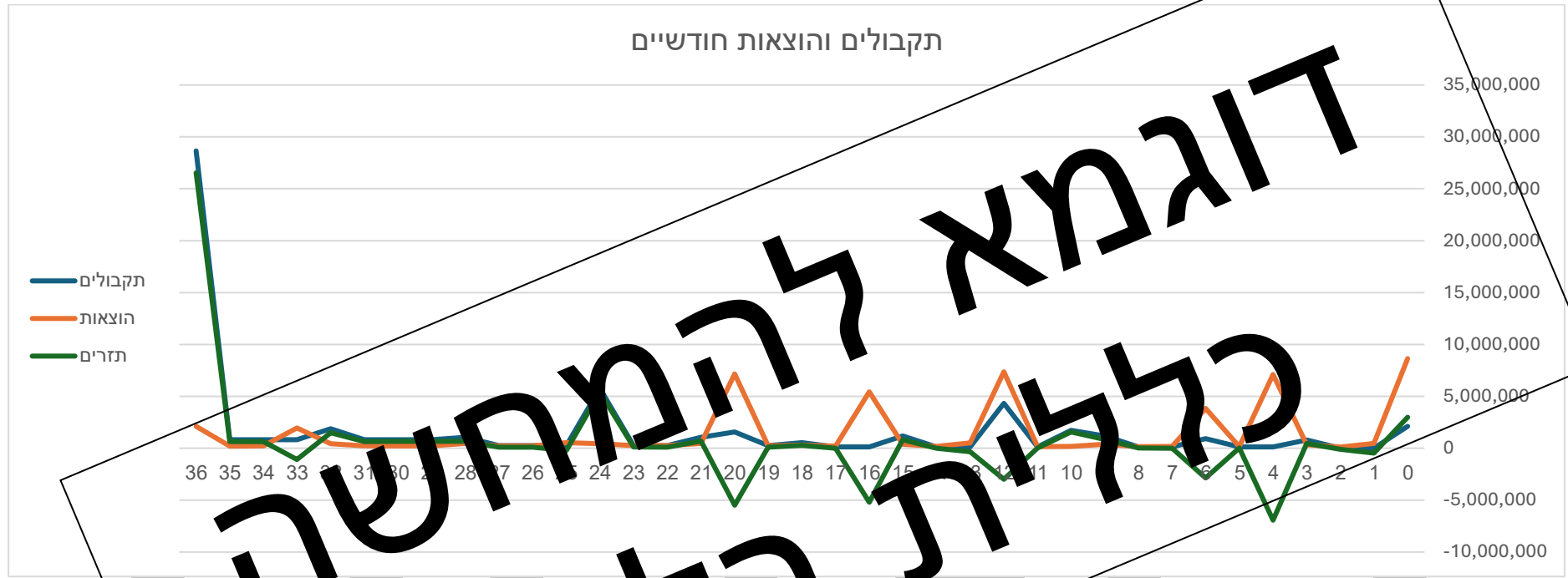
תקבולים והוצאות חודשיים